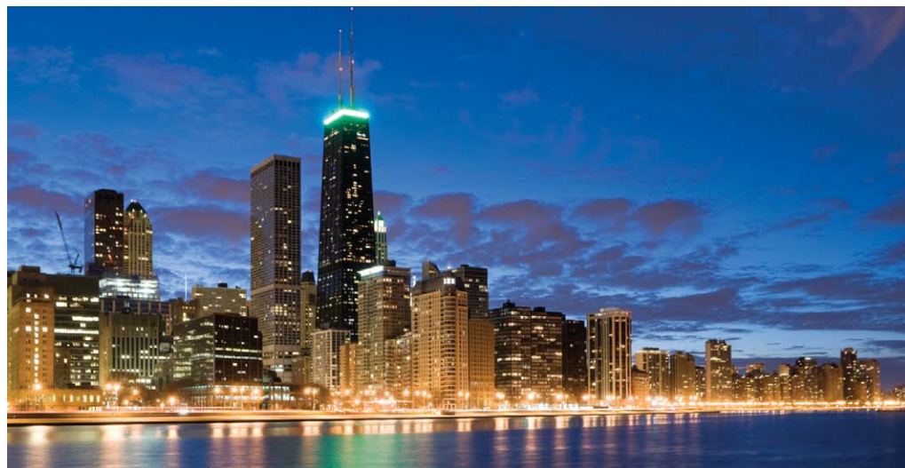
Downtown Chicago Skyline