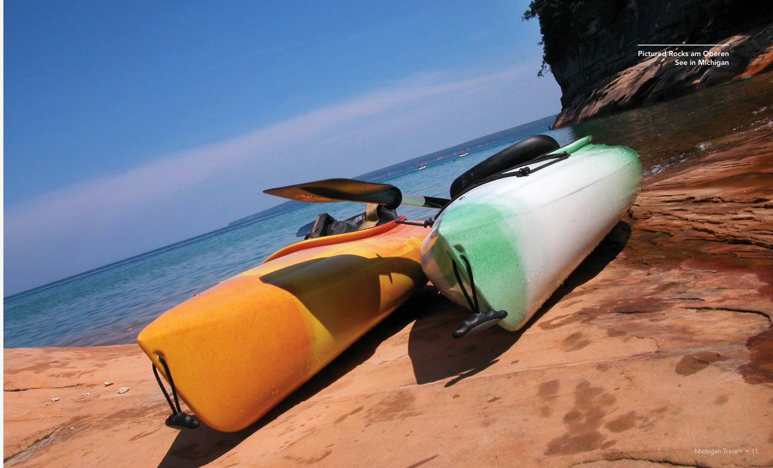
Pictured Rocks am Oberen See in Michigan

Sie machen sich alleine auf den Weg und erkunden das Gebiet nach Ihren eigenen Vorstellungen. Wenn doch einmal Fragen auftauchen sollten: Wir sind für Sie da. Eine deutschsprachige Unterstützung ist jederzeit für Sie in Michigan erreichbar.