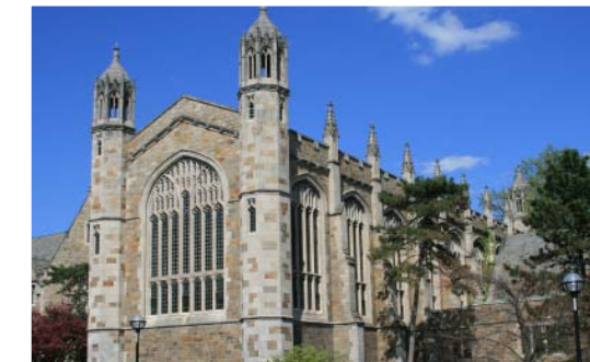
Oben: Toronto Mitte: Niagara-on-the-Lake Unten: Ann Arbor, Michigan