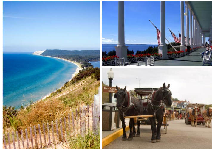
Links: Sleeping Bear Dunes, Michigan Oben rechts: Mackinac Island, Michigan Unten rechts: Mackinac Island, Michigan